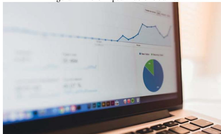
Figura 1 – Lorem ipsum dolor sit amet

Lorem ipsum dolor sit amet, consectetur adipiscing elit. Praesent blandit purus mi, sit amet varius velit sagittis ac. Nunc vitae convallis justo. Ut ligula dui, vulputate in gravida nec, sollicitudin vel urna. Fusce et placerat libero. Cras lobortis mi at blandit sodales.